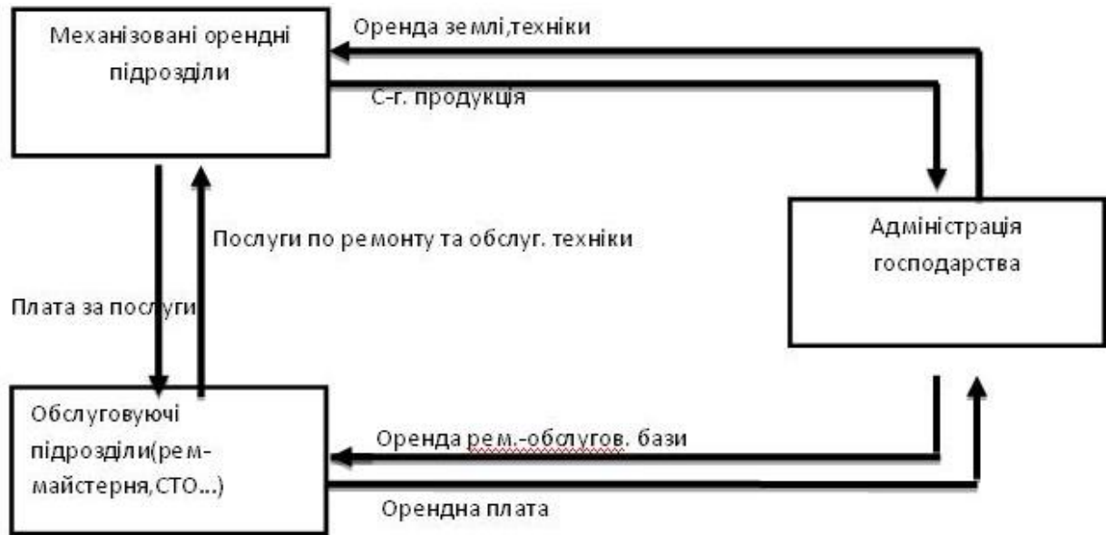
Рис.1. Схема організації внутрішньогосподарської оренди техніки