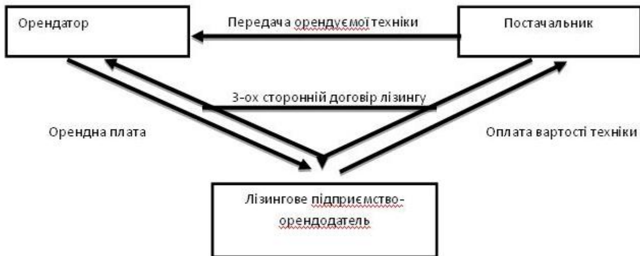
Рис.2. Схема організації лізингу техніки

Один з головних принципів орендних відносин – повернення орендуємих засобів виробництва. Природні ресурси (земельні угіддя) повинні бути повернуті орендодавцю тільки в натуральній формі, а техніка може бути повернута як в натуральній так і у вартісній формах. Як показує зарубіжний досвід перспективним методом забезпечення машинами аграрного виробництва і їх ефективного використання є орендою техніки, що одержала назву лізингу. Це особлива форма, яка несе в собі елементи поєднання оренди з фінансуванням капітальних вкладень. Як видно з рис. 2 в схемі організації лізингу техніки приймають участь три сторони: орендатор, орендодавець і постачальник. Оренда виконує тільки фінансові функції і заключає трьох сторонній договір.