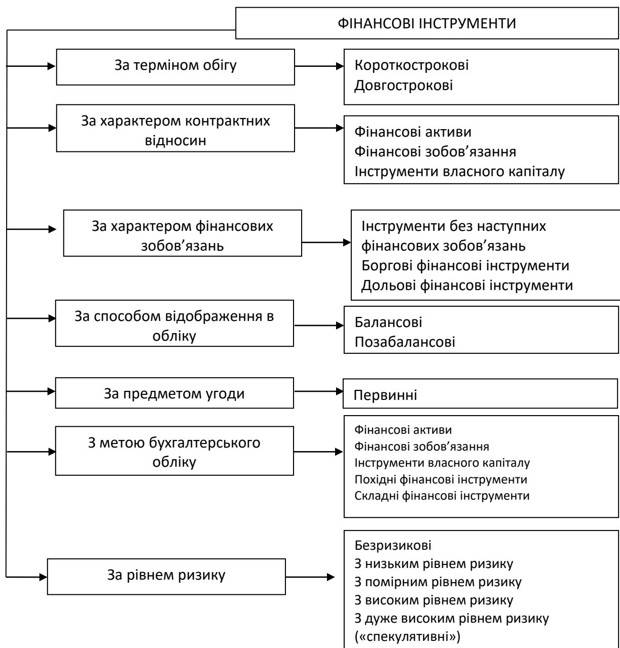
Рис. 2. Класифікація фінансових інструментів