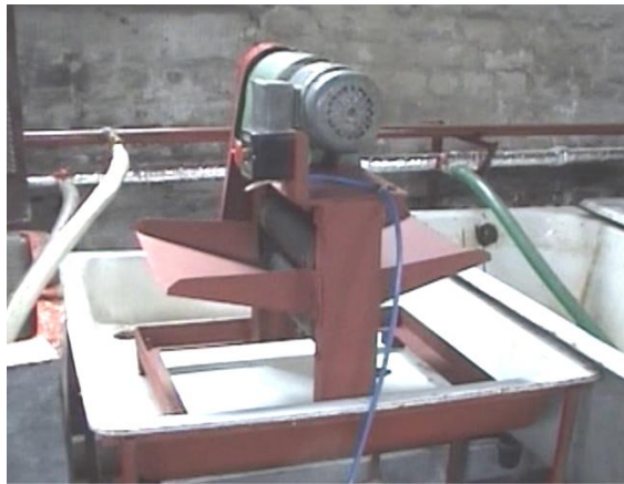
Рисунок 1 – Експериментальна установка з двовалковим робочим органом

Для дослідження процесу віджимання вологонасиченої вовни при незначних зусиллях стискання виготовлено експериментальний зразок віджимного пристрою ВП-8,0 та створено експериментальну установку з двовалковим робочим органом (рис. 1).