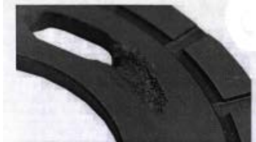
Рисунок 3 – Зовнішній вигляд дефектного сталюого розподільника

Працюючи в складних умовах, а саме під дією тиску до 35 МПа, вплив абразивних частинок в робочій рідині, продуктів зношення в самих сполученнях і якості робочої рідини деталі вузлів піддаються гідромеханічному зносу, ці часточки внаслідок різальної дії призводять до утворення на поверхнях подряпин, рисок і зміни геометрії деталей. Все це призводить до погіршення їх роботи та втрати працездатності.