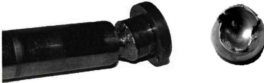
Рисунок 2 – Вигляд можливого спрацювання поршня та під'ятника

Проаналізувавши наукові роботи в яких досліджувалась надійність [6,7,8,9,10] та провівши власні дослідження ГСТ зернозбиральних комбайнів в господарствах Чернігівської області зроблено висновок, що найбільший вплив на довговічність та безвідмовність гідроагрегатів трансмісії під час експлуатації мають: якість робочої рідини, режим роботи та характер навантажень.