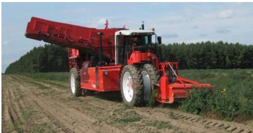
Рис 2 Самохідний картоплезбиральний комбайн Dewulf (Бельгія)