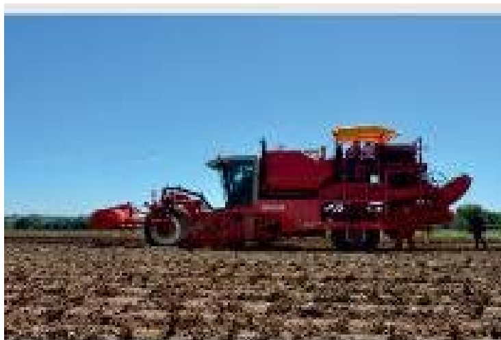
Рис. 3 Самохідний картоплезбиральний комбайн КСК-7500 (Білорусь)

Аналіз результатів виконання збиральних робіт із застосуванням причіпних та самохідних комбайнів виявив: