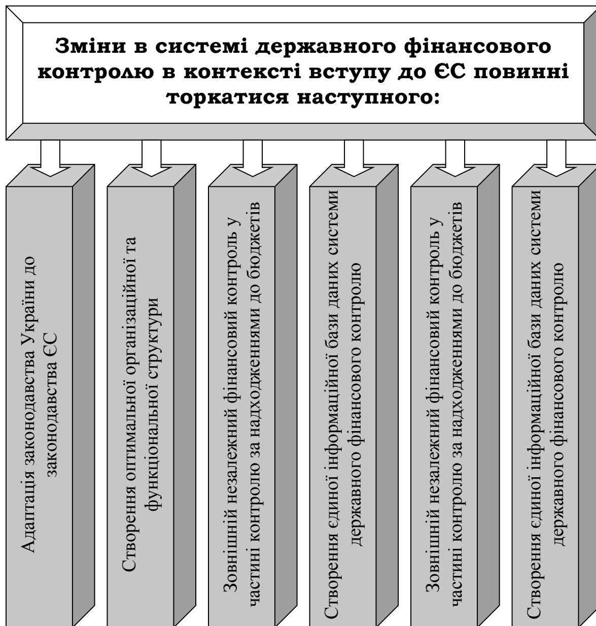
Рис.2. Сфери змін в системі державного фінансового контролю в контексті вступу до ЄС

Реалізація процесу реформування системи державного фінансового контролю за визначеними напрямками повинна відбуватися поетапно, з чітко визначеним планом дій із зазначенням цілей, термінів виконання та відповідальних виконавців.