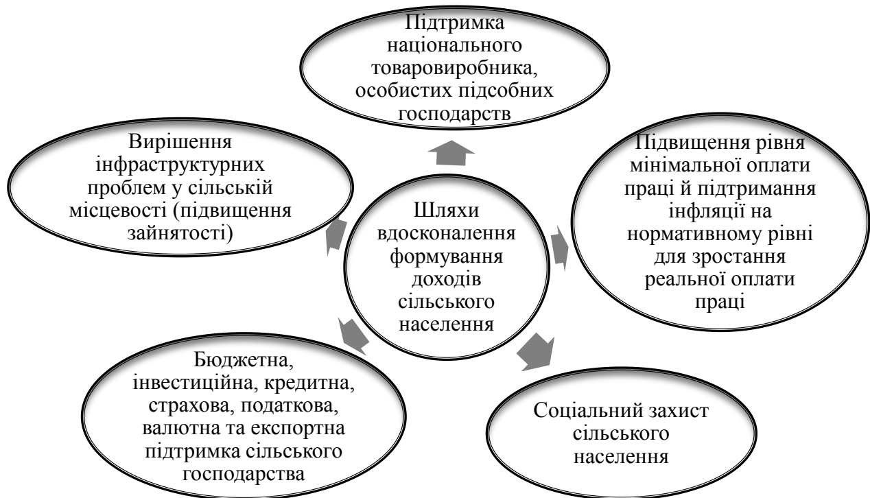
Рис. 2. Шляхи вдосконалення формування доходів сільського населення